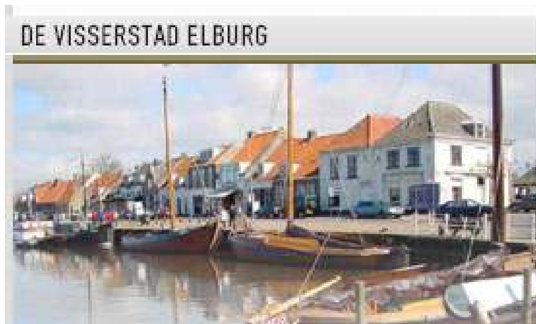
DE VISSERSTAD ELBURG

Door het realiseren van goede voorzieningen.