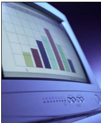
Computer en internet: niet meer weg te denken