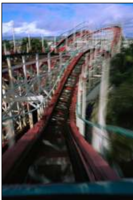
Het bezoeken van een attractie is voor veel Nederlanders een populair uitje.

Uit het TBO van 2005 blijkt dat men in Nederland gemiddeld 9,1 uur per week onderweg is en dat het grootste deel van deze mobiliteit voor rekening van de vrijetijdsactiviteiten komt. De auto is het meest gebruikte vervoermiddel (80%). De fiets en het openbaar vervoer hebben gezamenlijk slechts een aandeel van 15%. Voor de aantrekkelijkheid van een stad of vrijetijdsvoorziening speelt bereikbaarheid dus een steeds belangrijkere rol. 40% van de vrijetijdsactiviteiten wordt ondernomen binnen de eigen gemeente, 57% elders in Nederland en 3% in het buitenland. 35% van de activiteiten wordt ondernomen binnen een straal van 5 kilometer vanaf het woonadres en bij slechts 18% gaat de verplaatsing over een afstand van meer dan 30 kilometer.