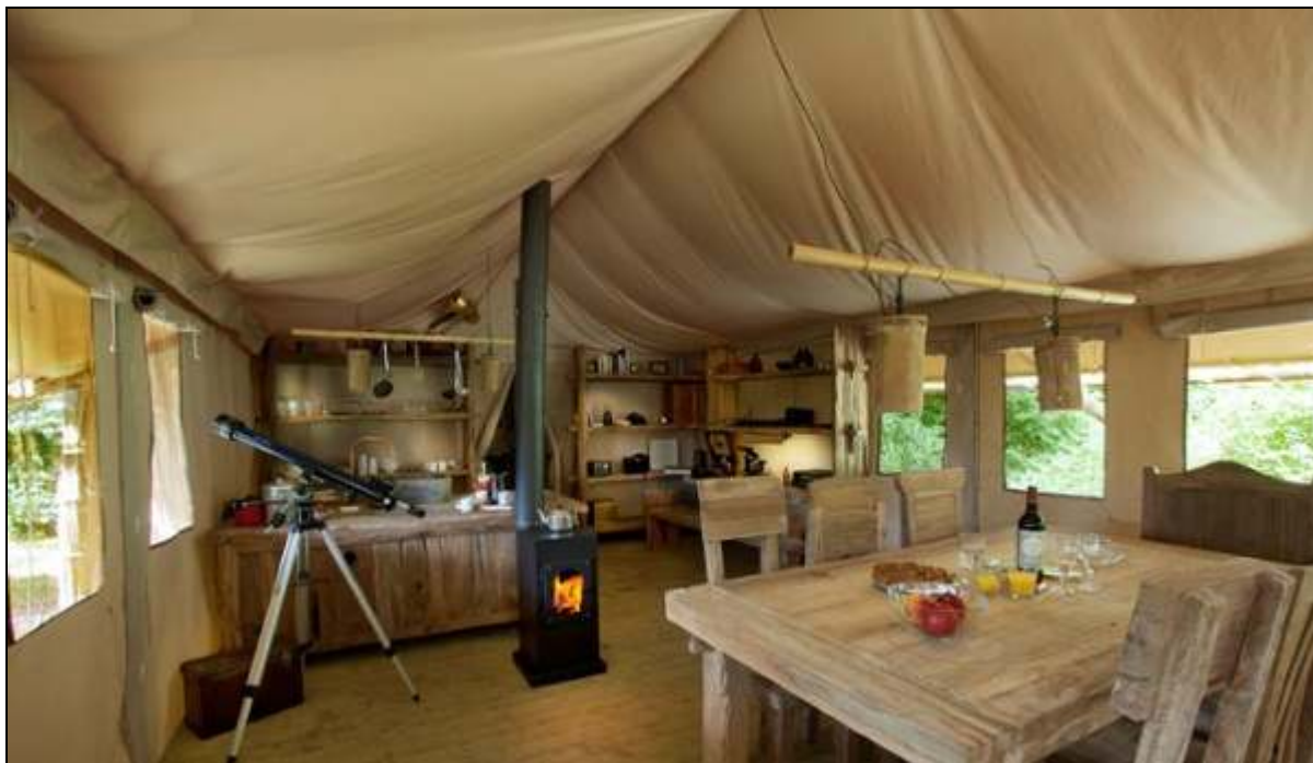
Nieuwe vorm van luxe kamperen: Het verborgen verblijf in Doornspijk